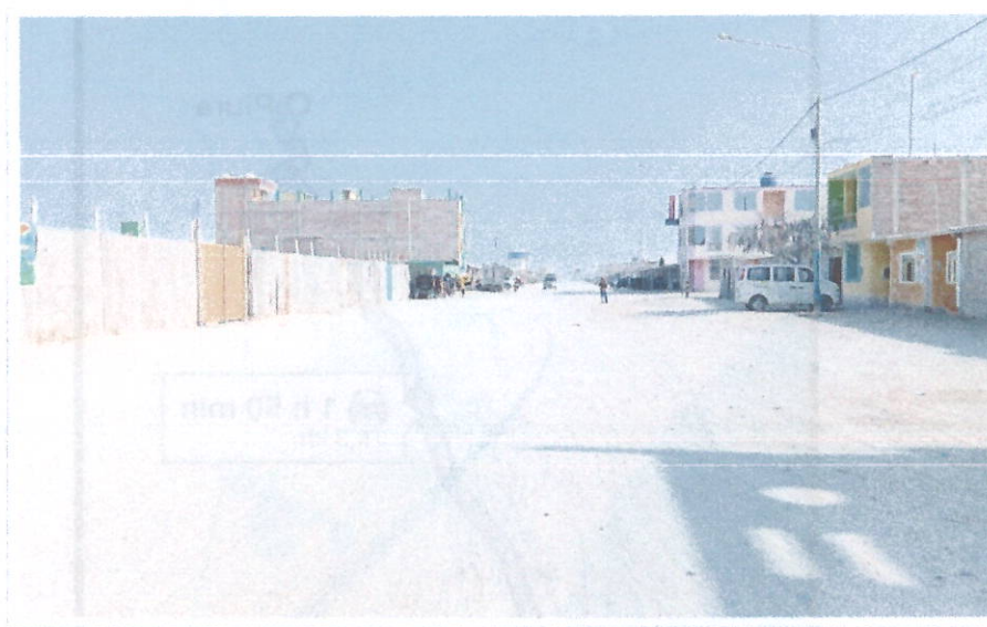
IMAGEN N° 03.- IMAGEN FRONTAL DEL TERRENO

El proyecto consiste en la ejecución de la obra denominada: "MEJORAMIENTO DEL SERVICIO DE EDUCACION INICIAL EN 3 UNIDADES PRODUCTORAS, DISTRITO DE SECHURA, BERNAL DE LA PROVINCIA DE SECHURA DEL DEPARTAMENTO DE PIURA", META 01 – "INICIAL N°724 - NVO PARACHIQUE" CON CÓDIGO ÚNICO DE INVERSIONES N° 2605861.