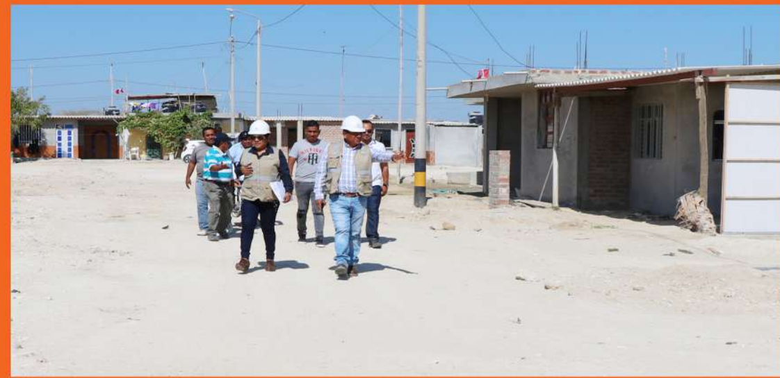
Sistema de agua y alcantarillado en A.H. La Primavera - Distrito de Vice S/ 2'127,784.62