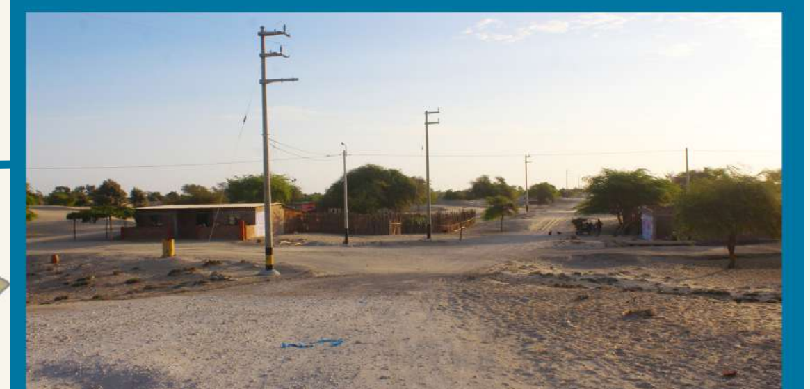
Electrificación en Caserios Mala Vida, Chutuque, Los Jardines, Valverde Distrito Cristo Nos Valga S/ 901,916.42