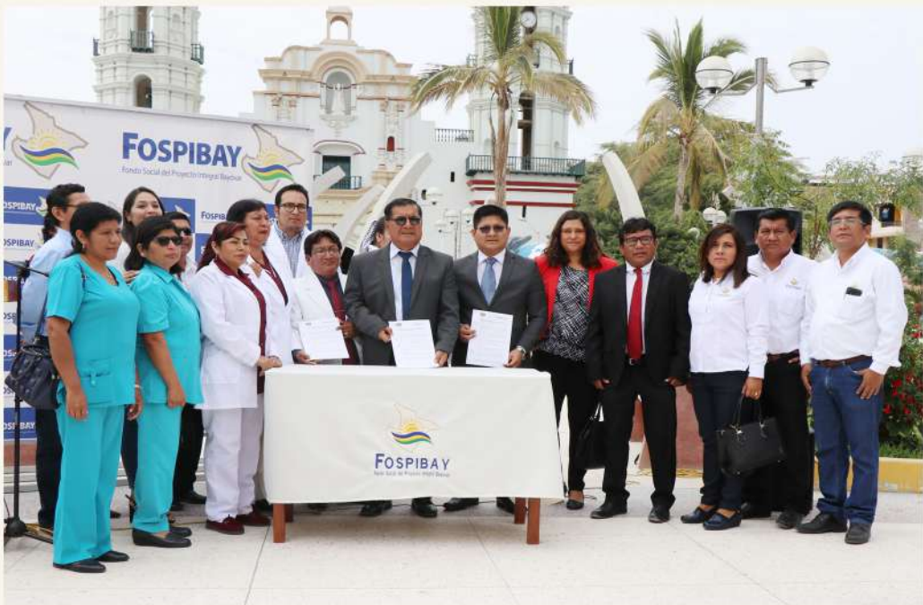
Por una mejor calidad de atención médica en Sechura.

Se ha firmado el convenio de cooperación interinstitucional entre el FOSPIBAY y CLAS SECHURA con la finalidad de sumar esfuerzos conjuntos de manera coordinada y articulada para mejorar la calidad de la atención médica en general en el ámbito de la provincia de Sechura.