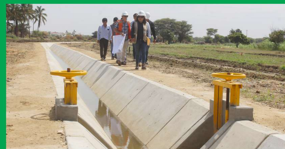
Canal Leonardo en Caserío Santa Rosa Distrito de Vice S/ 352,685.98