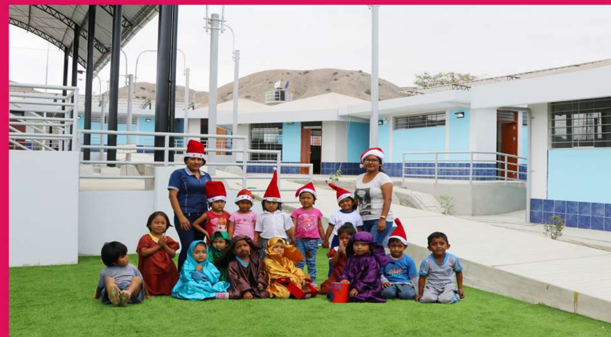
Nueva Infraestructura de I.E. 20208 Nivel Inicial - Caleta Puerto Rico - Bayóvar S/ 2'639,451.12