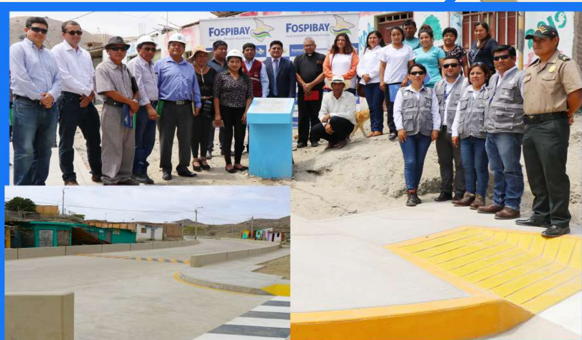
Mejoramiento de transitabilidad vehicular y peatonal - Caleta Puerto Rico S/ 3'452,199.77