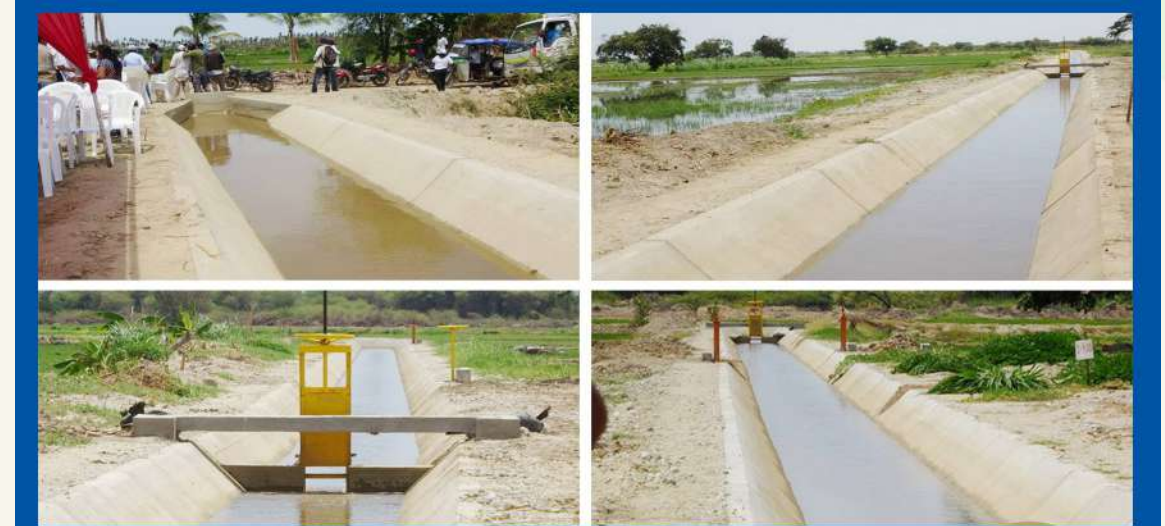
Canal "Tierras Coloradas" Distrito Bernal S/ 2'478,636.67