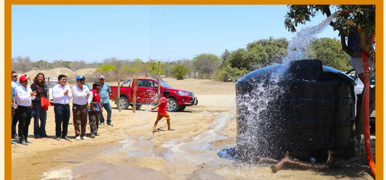
Perforación de seis Pozos para dotación de agua en el desierto de Sechura. S/ 2'910,826.59

FOSPIBAY asumió el financiamiento del perfil, factibilidad y expediente técnico del Proyecto de Agua y Alcantarillado para el C.P. Parachique -La Bocana por un monto total de S/2'801,995.10