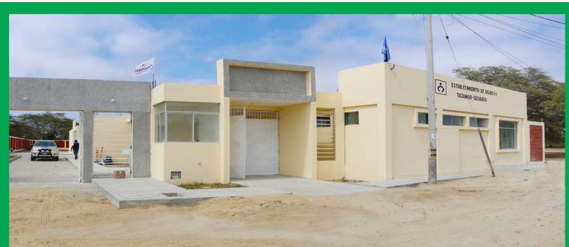
Establecimiento de Salud I-1 - Tajamar S/ 1'248,744.59