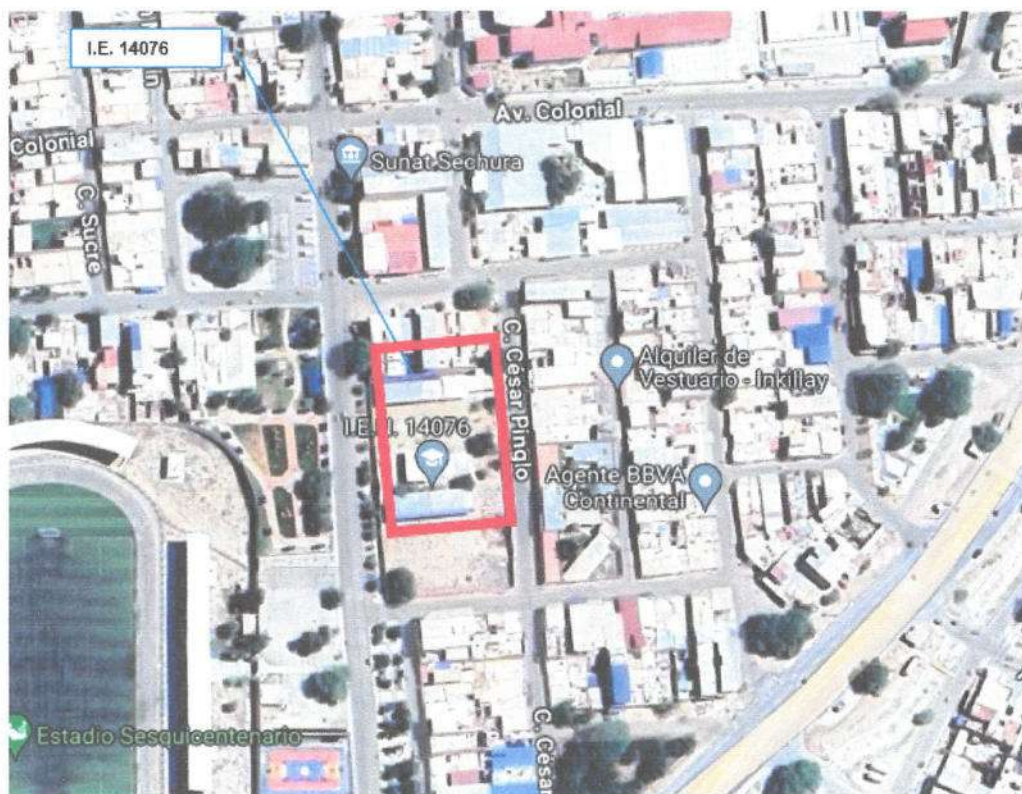
Imagen satelital – Sechura