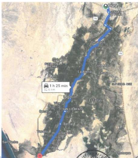
IMAGEN N° 01.- RUTA DE ACCESO HACIA LA I.E. 14076

El acceso a la Institución Educativa N° 14076 en el distrito de Sechura, el trayecto por carretera entre Piura y Sechura abarca una distancia de 51 kilómetros. El viaje dura aproximadamente 43 minutos, transitando por Distrito de Catacaos, La Arena, La Unión, Bellavista, Dos Pueblos y Vice. La vía está asfaltada en buen estado de conservación conforme se detalla en la imagen adjunta: