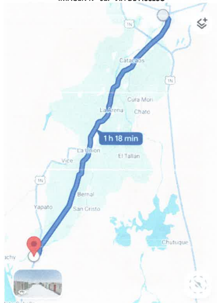
IMAGEN N° 01.- VIA DE ACCESO

Para acceder a la zona de acción, es a través de la carretera Piura - Sechura.