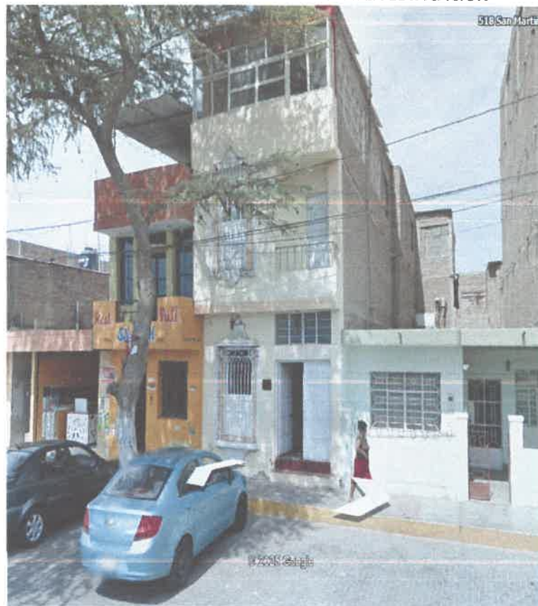
IMAGEN N° 03.- IMAGEN FRONTAL DE LA EDIFICACION

El área del proyecto de la ASOCIACION SANTA MARIA DE GUADALUPE se encuentra ubicada en el Cercado urbano de Sechura Mz "63" lote 5, del distrito y Provincia de Sechura. Cuenta con infraestructura existente, la misma que estará sujeta a remodelación