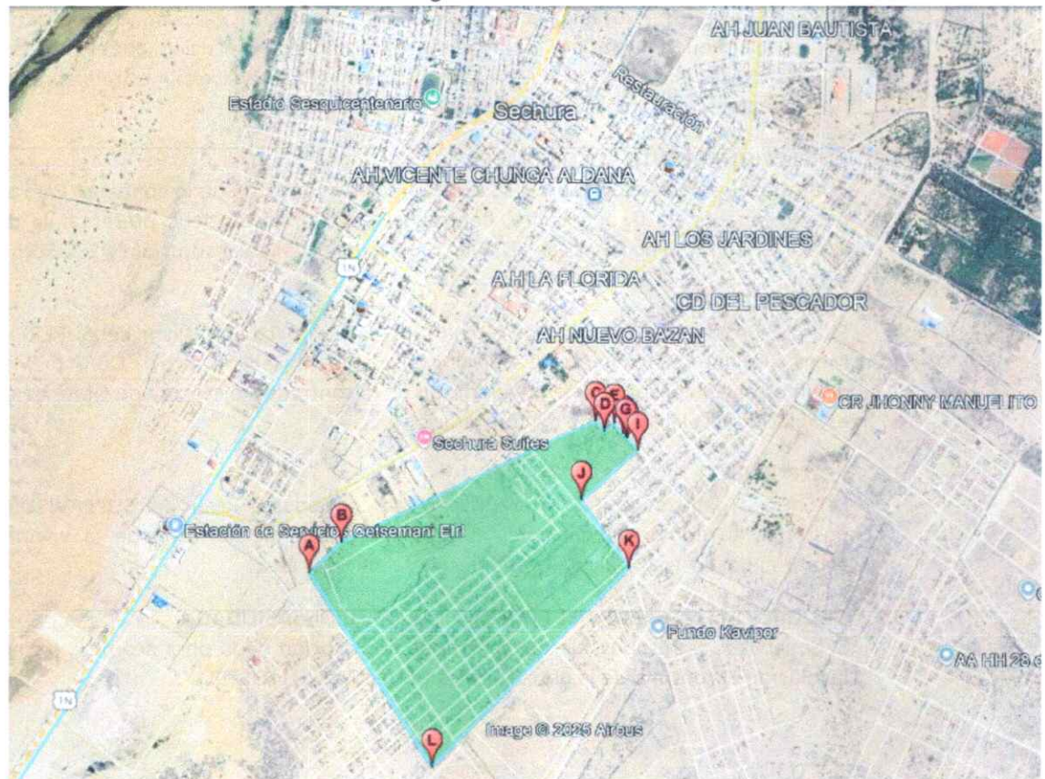
Imagen N° 01

Localidades : AA.HH. Los Portales Distrito : Sechura Provincia : Sechura Departamento : Piura