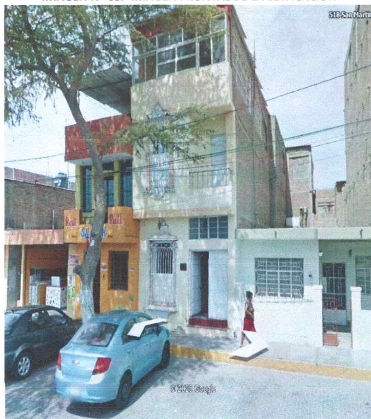
IMAGEN N° 03.- IMAGEN FRONTAL DE LA EDIFICACION

El área del proyecto de la ASOCIACION SANTA MARIA DE GUADALUPE se encuentra ubicada en el Cercado urbano de Sechura Mz "63" lote 5, del distrito y Provincia de Sechura. Cuenta con infraestructura existente, la misma que estará sujeta a remodelación